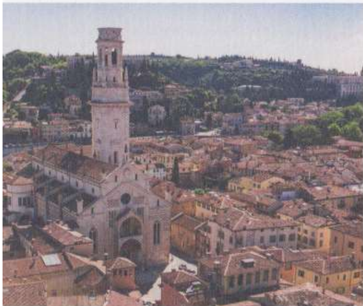
Cathédrale Santa Maria Matricolare, Vérone