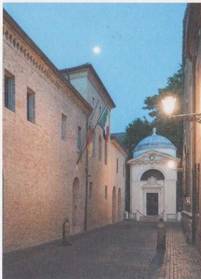
Tombeau de Dante, Ravenne

À l'occasion de ces commémorations, la ville a complètement rénové les lieux célébrant le poète : le Quadraro di Braccioforte , la maison et le musée de Dante . Parmi les nombreux rendez-vous annoncés, allant du street art à la musique contemporaine, figurent plusieurs expositions, à commencer par Les yeux et l'esprit. L'art au temps de l'exil dans l'église de San Romualdo (24 avril-4 juillet), tandis qu'au MAR , le musée d'art de Ravenne, Une épopée pop retrace le succès populaire de l'œuvre de Dante à travers les siècles (4 septembre-9 janvier 2022). La ville propose également une visite virtuelle de ses expositions, une promenade dans la forêt où se dressent encore les grands chênes chers au poète, mais aussi la Lecture perpétuelle de La Divine Comédie , tous les jours au coucher du soleil près de sa tombe. De plus, la 22 e édition du Ravenna Festival accueillera cet été plusieurs concerts et spectacles consacrés à Dante. Programmes à retrouver sur www.vivadante.it et www.ravennafestival.org