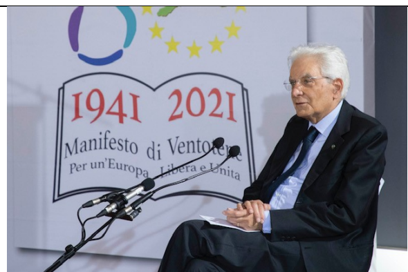
Ventotene 29/08/2021: Il Presidente Sergio Mattarella al centro polifunzionale "Umberto Elia Terracini" ,in occasione del 40° seminario per la formazione federalista europea,nell'80° anniversario del Manifesto di Ventotene Visita a Ventotene (quirinale.it)

Il testo del manifesto è reperibile qui .