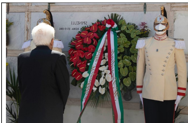
Ventotene 29/08/2021: Il Presidente della Repubblica Sergio Mattarella, a Ventotene, depona una corona di fiori sulla tomba di Altiero Spinelli Visita a Ventotene