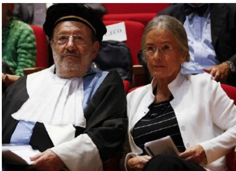
Umberto Eco e la moglie

La sua biblioteca di libri antichi denominata " Bibliotheca semiologica curiosa, lunatica, magica et pneumatica " che conta circa 1.200 edizioni anteriori al Novecento, un patrimonio che comprende 36 incunaboli e 380 volumi stampati tra il XVI e il XIX secolo sarà custodita dalla Biblioteca Nazionale Braidense di Milano (Pinacoteca di Brera) che ne garantirà la conservazione, la valorizzazione e la fruizione a studenti e studiosi.