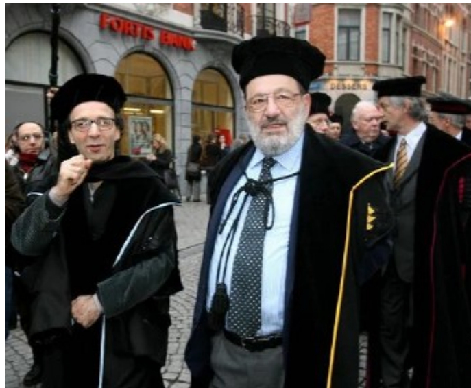
Umberto Eco e Roberto Benigni