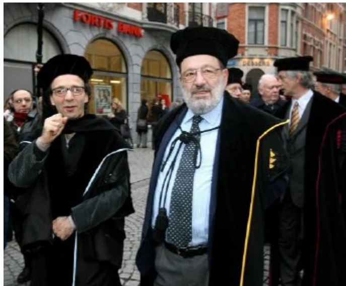
Umberto Eco e Roberto Benigni