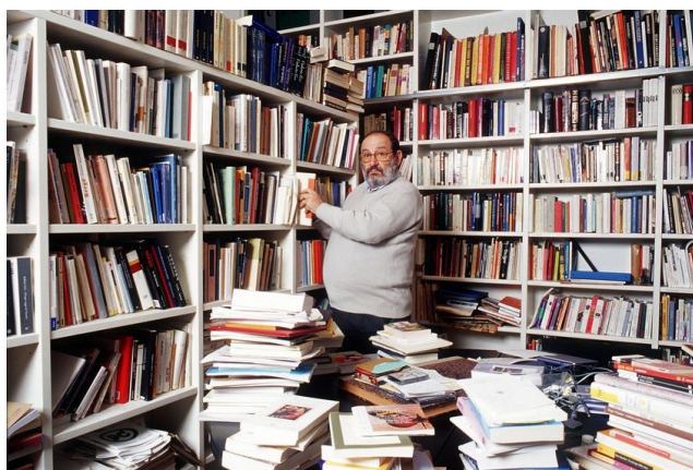
Umberto Eco

Umberto Eco semiologo, filosofo, scrittore, traduttore, saggista, accademico, bibliofilo e medievista italiano è scomparso a 84 anni, il 19 febbraio 2016.