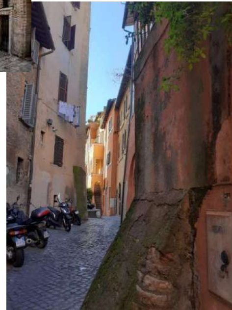
Automne 2019 : Escapade à Rome