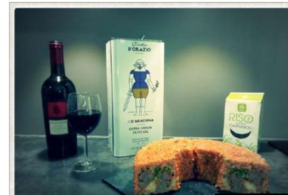
Sartù di riso - 16 mai 2019