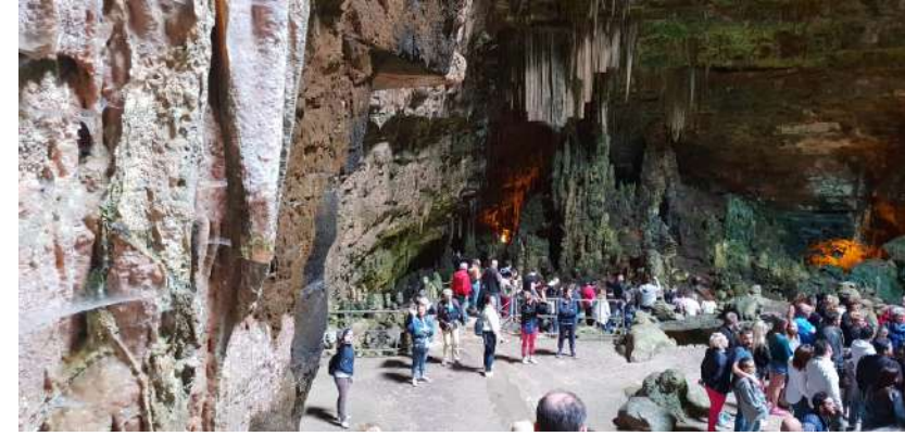
Printemps 2017 : Voyage en Calabre

En Italie, découverte du patrimoine italien avec des guides locaux