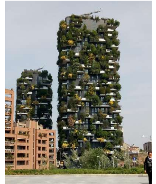
Printemps 2019 : Voyage à Milan