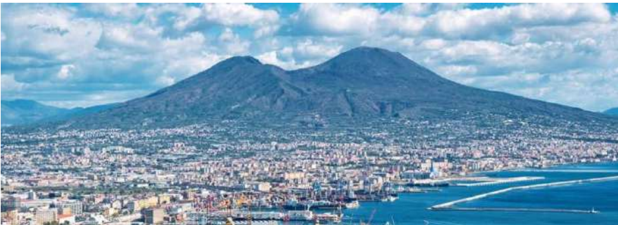
26 février 2021 Printemps 2020 : Voyage à Naples annulé (COVID-19)