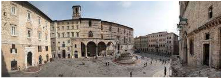
Printemps 2018 Voyage dans Les Pouilles