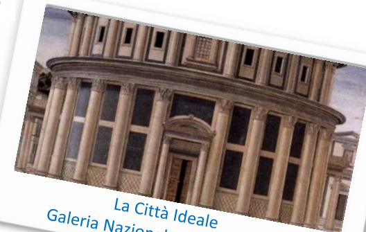
La Città Ideale Galleria Nazionale delle Marche